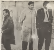
Riba e grafica di prome ta oparaan taan Amatricich di 41 aña (robo) kende hanta cu su señora a wordo deteni como espia. Riba e otro tin un escena na unda un tal "John" por recorda mira, kende a wordo forsa pa actua como espia.